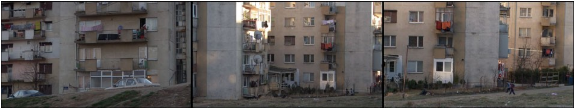
« Pristina, Mars 2008 » de Félix Albert et Luca Wyss