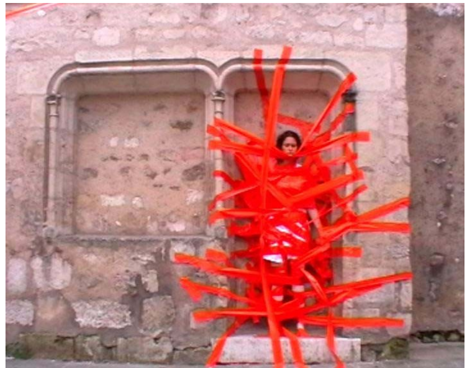
« Scotch Madone » de Fériel Boushaki