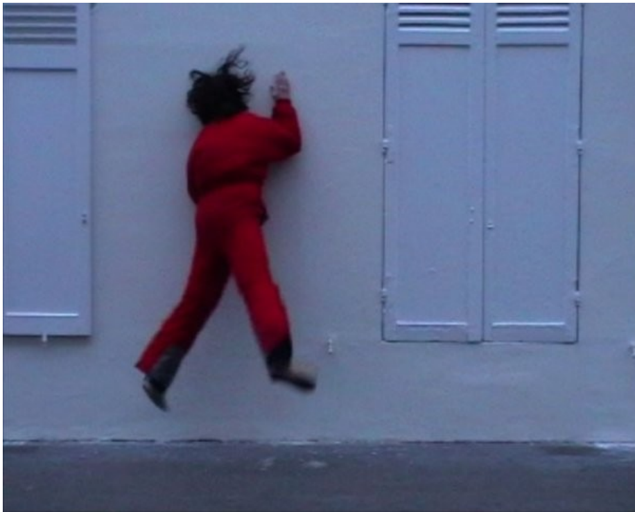
« Rouge » de Fériel Boushaki