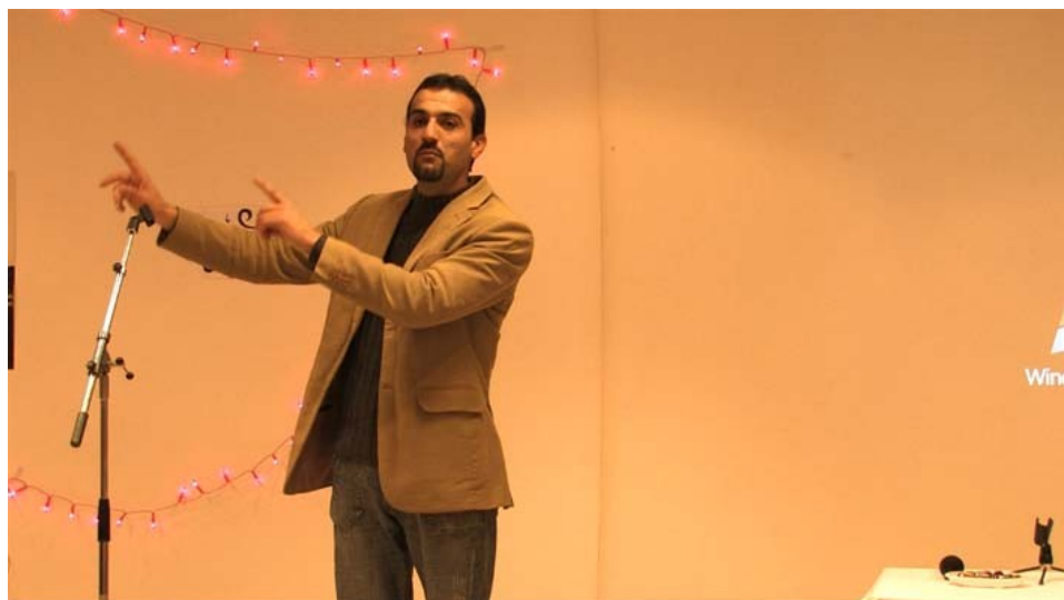
« Aïd el Kebir, Paris, 2008 » de Félix Albert